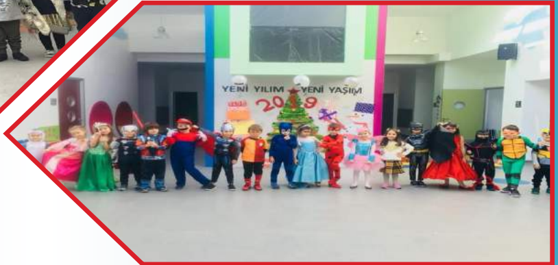
YENİ YILIM YENİ YAŞIM PARTİSİ