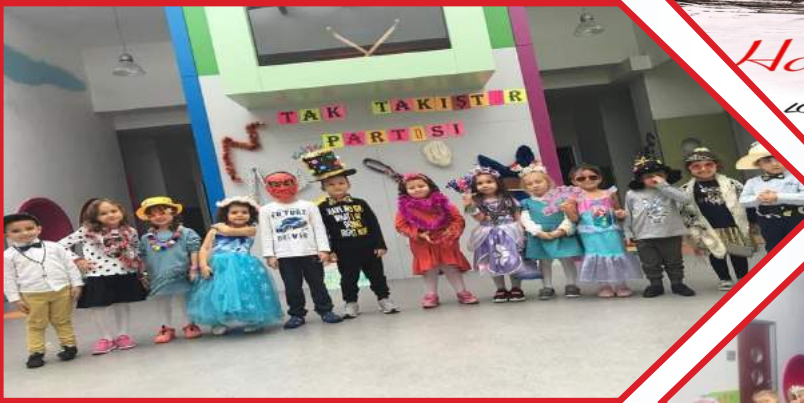
TAK TAKIŞTIR PARTİSİ